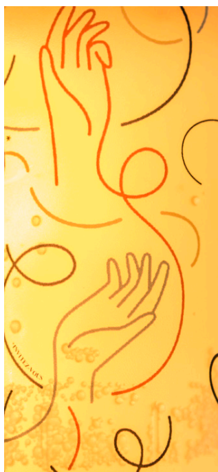
Take a Wip

« les lieux infinis : des endroits qui sont conçus, pensés et animés de façon à ce que tout soit possible. »